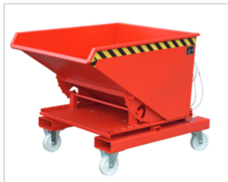
3S mit Rollen