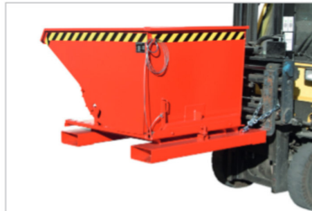
3S, Kipprichtung nach rechts