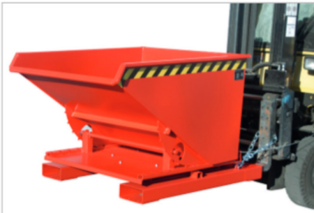
3S, Kipprichtung nach vorne