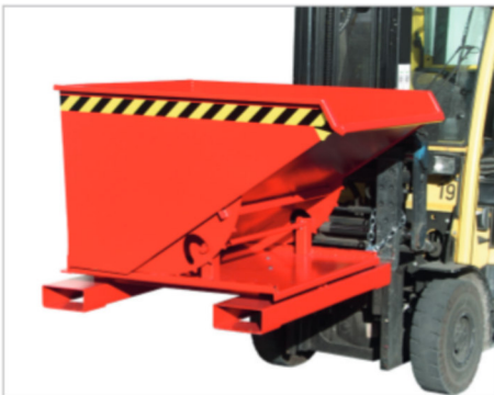
3S, Kipprichtung nach links